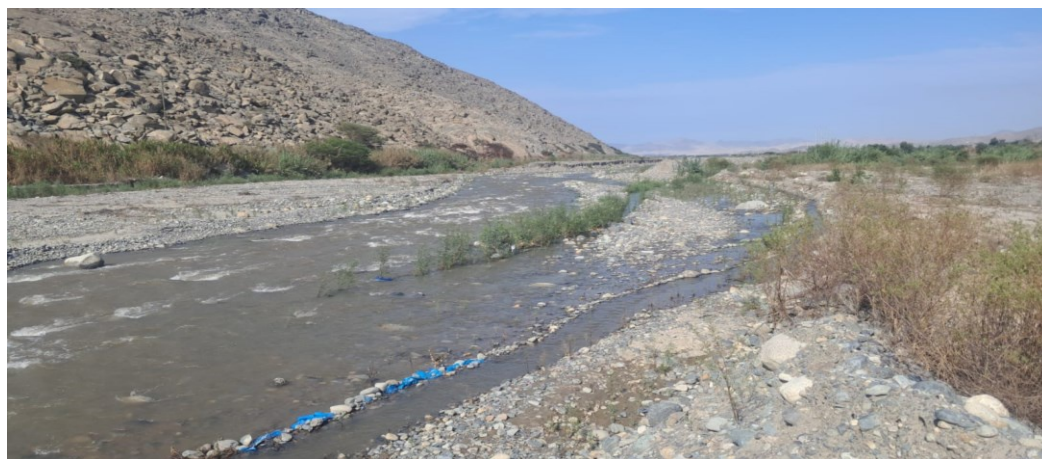
FIGURA N°02.- EN LA FOTOGRAFIA EL DIQUE DE LA MARGEN DERECHA HA SIDO EROSIONADOS POR EL AUMENTO DEL CAUDAL DEL RIO NEPEÑA