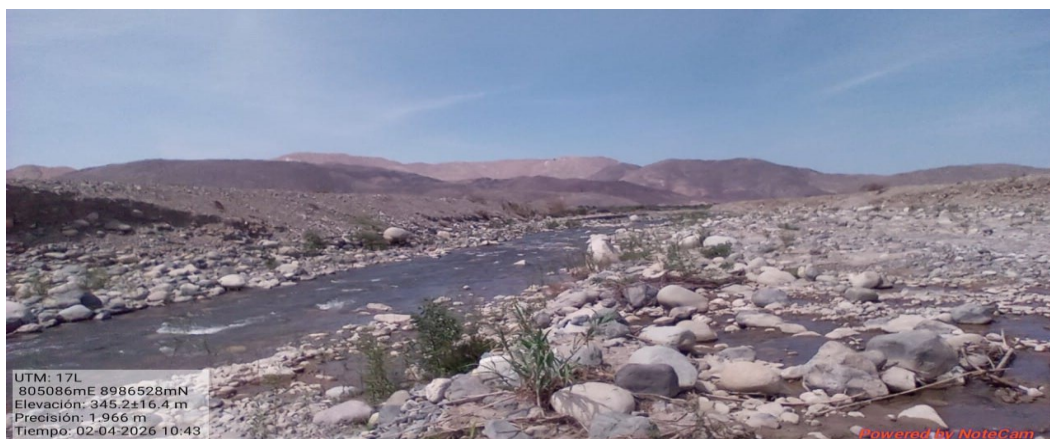
FIGURA N°1 TRAMO DEL CAUCE DEL RIO NEPEÑA COLMATADO, UNA ALTURA APROXIMADAMENTE DE 0.70M.